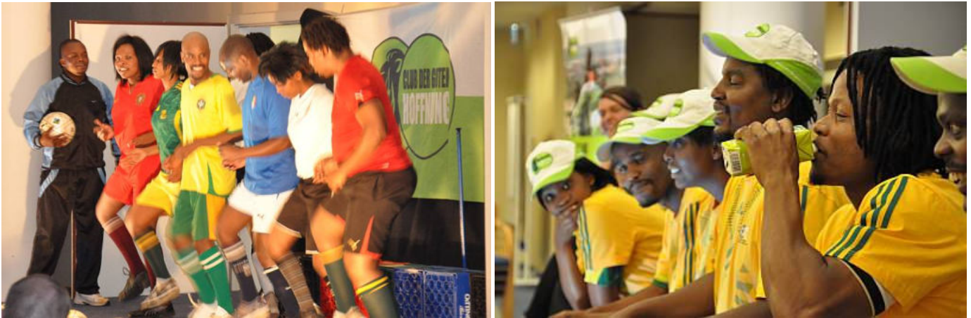
AJOBA! beim TeeGschwendner Jahrestreffen im Mai 2010 in Bonn—Theater und anschließender Austausch der Franchisepartner mit den Schauspielern